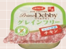
シニア犬用 チキン