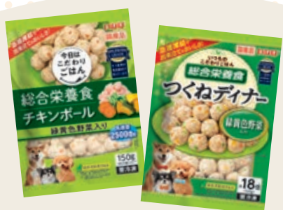
総合栄養食 チキンボール