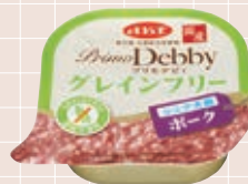
シニア犬用 ポーク