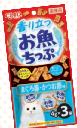
まぐろ節・かつお節味