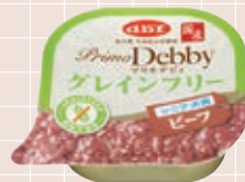
シニア犬用 ビーフ