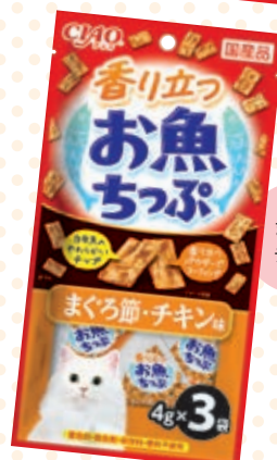
まぐろ節・チキン味