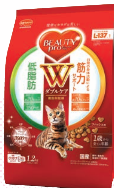
低脂肪・筋力サポート (150g/1.2kg)