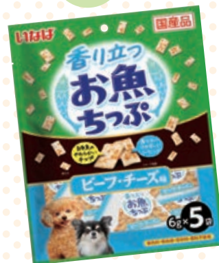
ビーフ・チキン味