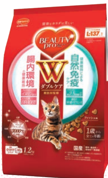
腸内・自然免疫ケア (150g/1.2kg)