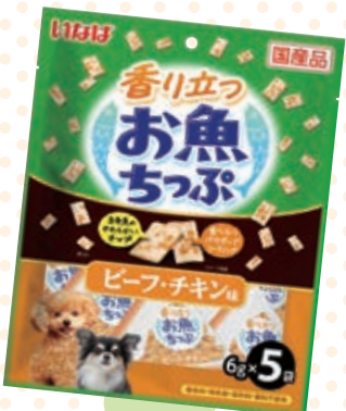
ビーフ・チキン味