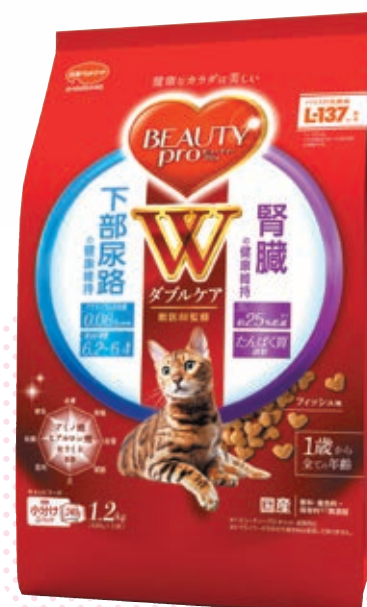
下部尿路・腎臓の健康 (150g/1.2kg)